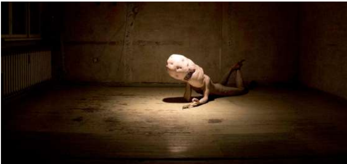
Юлиян Табаков – от серията „Ние, чудовищата“, 2015–2019, дигитален принт върху фотохартия.