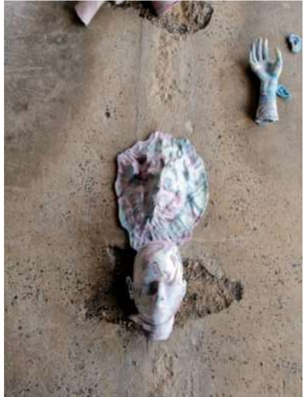
Лора Димова – „Небесно тяло“, 2019, смесена техника, вариращи размери.