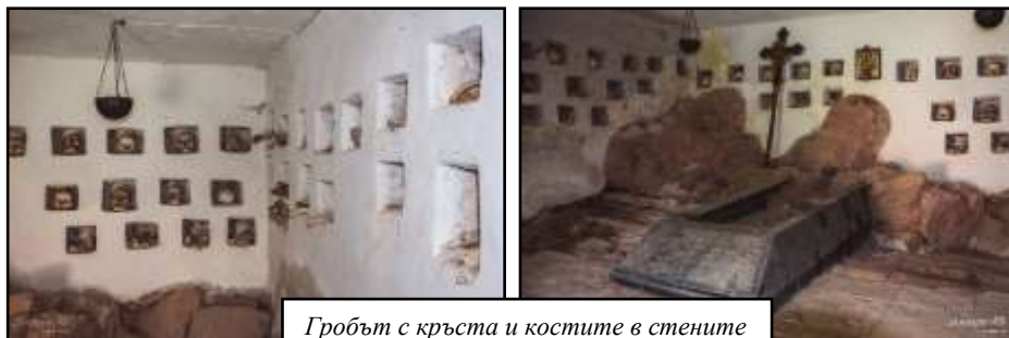
Гробът с кръста и костите в стените

Помещението представлява малка стая, в средата на която има съоръжение, наподобяващо гроб с надпис (вдясно) на църковнославянски: „ Чада на родната земя, вий паднали в бран за българската свобода, вечна слава вам!... “ (своеобразен превод). На гроба има подпрян дървен кръст, а над него икона. Най-силно впечатление обаче правят квадратните дупки в стената, в които има поставени черепи и различни видове кости. Гледката е меко казано смразяваща, но и носи усещането за близост и в същото време за величие, че имаме шанса да стоим толкова близо до тленните останки на тези исторически фигури, които често битуват в нашето въображение като художествени образи – в този момент осъзнаваме, че тези хора са били съвсем истински и можем дори да усетим тяхното присъствие в помещението.