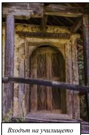
Входът на училището

дебелата сянка на дърветата и с музикален съпровод от горските пернати обитатели. Има здрав дървен мост, по който се стига до извора, а отстрани на него има малък красив водопад.