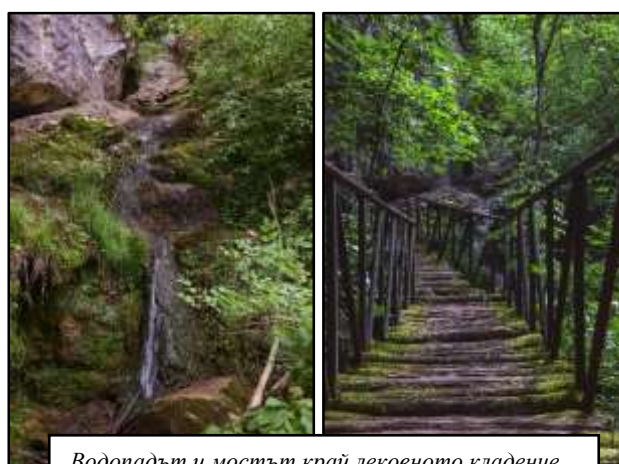
Водопадът и мостът край лековното кладенче

Местността, в която се намира изворът и еко пътеката, се нарича Магерското и крие много други загадки. Според легендата там преди е било много по-населено, но е бил убит един турчин и от страх да не се върнат събратята му да отмъстят за смъртта му, жителите се преселили на друго място. В наши дни екопътеката предоставя на