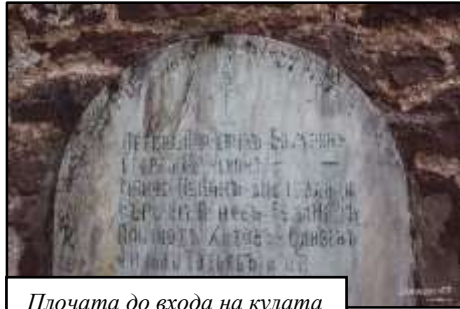
Плочата до входа на кулата