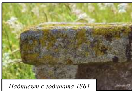
Надписът с годината 1864