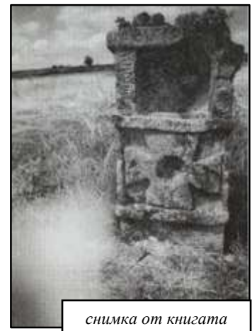
снимка от книгата

Тъй като в момента почти не се различават символи и изображения по паметника, открих негова по-стара снимка [2] (вдясно) в книгата „Хроника на едно странстващо село.