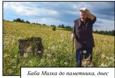
Баба Милка до паметника, днес

Мястото е обрасло, по камъка са тръгнали лишеи и плесени, а полето се е превърнало в змиарник. Баба Милка го отдава на това, че по-голямата част от населението са доста възрастни хора, които нямат сили да вървят повече от 30 минути, за да стигнат до голямата поляна и затова са намерили по-лесен вариант – гощават се с курбан в столовата на селото, а почитта си към Св. Илия изразяват в църквата.