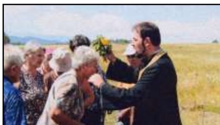
Молитва, курбан и празнично настроение „на оброко“ в деня на св. Илия; снимки от архива на баба Милка

Корените на самия празник са още от предхристиянски времена и се свързват със славянския бог Перун – бога на гръмотевиците и светкавиците. Днес на същия празник се почита Св. Илия Гръмовержец, който властва над същите небесни сили. Вярва се, че на този ден Св. Илия намята кожата си и отива да извика зимата и самият празник със съпътстващите го ритуали на оброчището са своеобразен опит да бъде омилоствивен