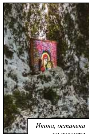
Икона, оставена на скалата