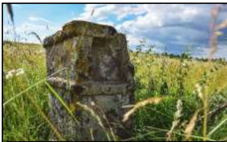
Оброкът и паметникът на с. Боровци