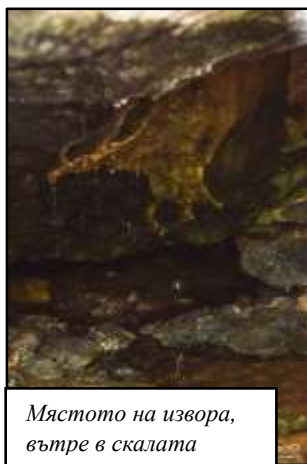
Мястото на извора, вътре в скалата

обаче то бива затрупано от скали след земетресението във Вранча. Неизвестно как,