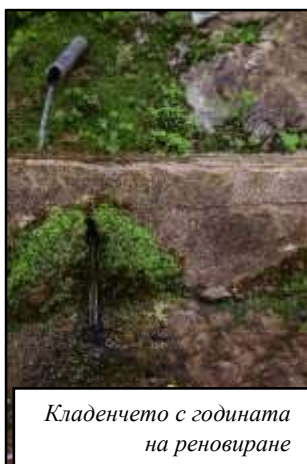
Кладенчето с годината на реновиране

след време скалите се наместили и направо от тях наново избил някогашният ручей, чиято вода притежава същите лековити сили. Водата капе директно от самата скала. Поради това чудно явление, днес хората са възприели мястото не само като лечебно, а и като вълшебно и сакрално – там те оставят икони, цветя и плат, дрехи и сувенири, молейки се и