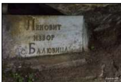
Плочи, обозначаващи извора

Третата спирка в моя маршрут се оказа в едно съседно на Боровци село –