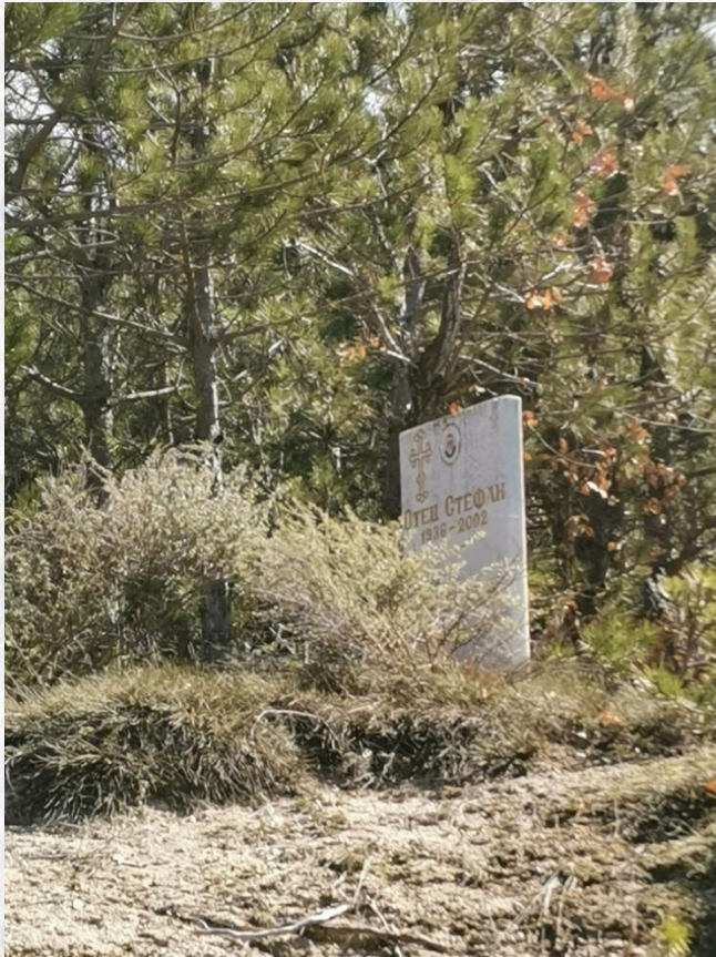
Надгробен камък на отец Стефан