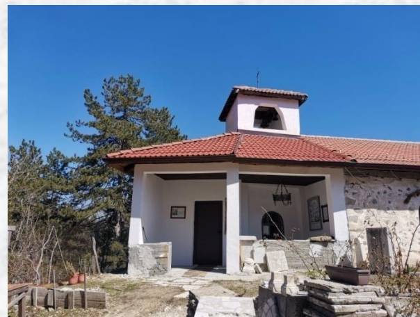
Сградата на манастира

Днес има възможност и да се пренощува там. Интересно е вярването, че човекът, на когото му се даде да отключи вратата на манастира, трябва да си пожелае нещо, докато отключва, а и самият акт носи късмет. Изключително приятно ми беше по време на моето посещение този човек да бъде аз.