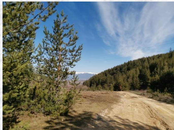
Прекрасната природа по пътя към манастира