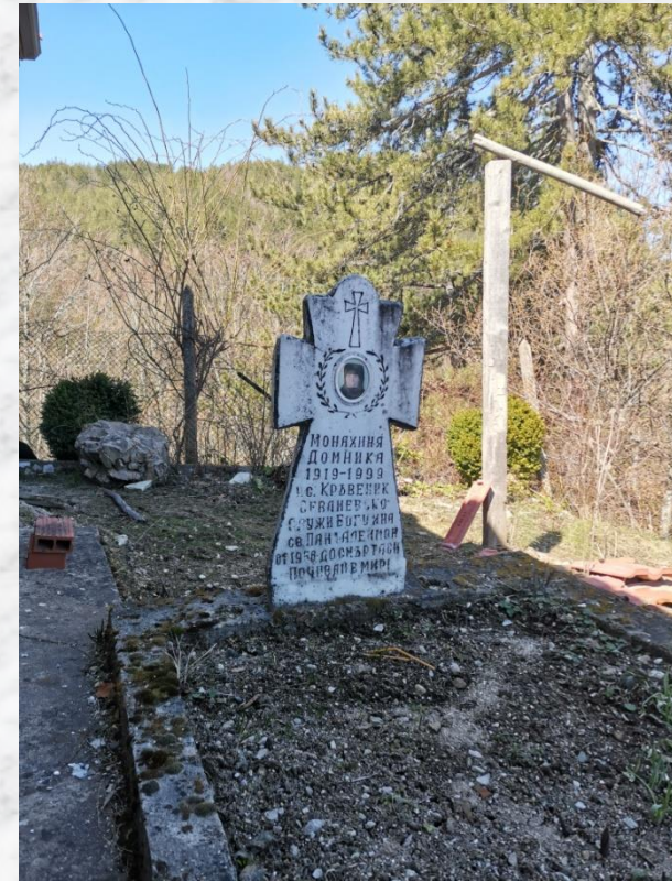
Надгробен камък на монахиня Доминика