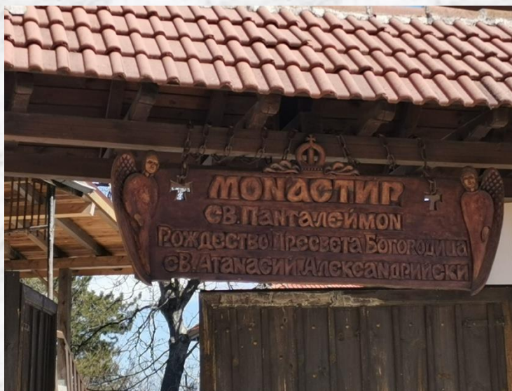
Надпис на входа на манастира

Защо? – Култовият обект възниква като мъжки манастир (сега вече е женски), едно от християнските места, посветени на Свети Атанасий Александрийски (1814 г.). Второто му име (1909 г.) е свързано с чудотворната икона на Пресвета Богородица „Достойно Ест”, (чиято история ще разкажа по-късно), донасяна в манастира само за празника ѝ, а именно “Рождество Богородично” (8 септември). “Официалното” име (1915 г.) пък се появява, тъй като възстановеният манастир е осветен именно на празника на Свети Пантелеймон – 27 юли 1915 г.