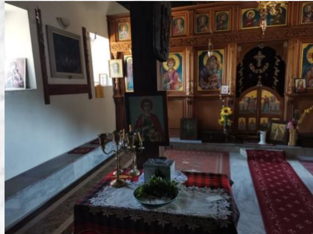
Здравец от манастира на фона на прекрасната гледка, която се разкрива от него