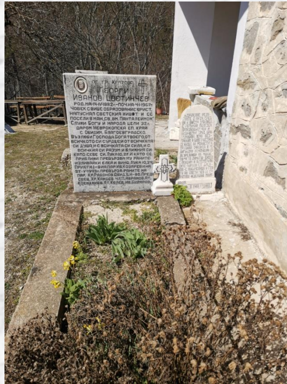
Надгробен камък на Георги Цветинчев