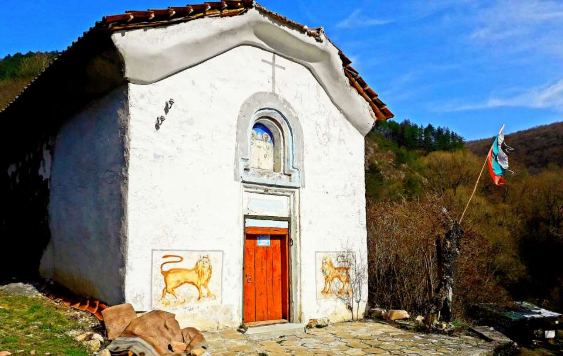
Долнопасарелски манастир “Свети Петър и Павел”