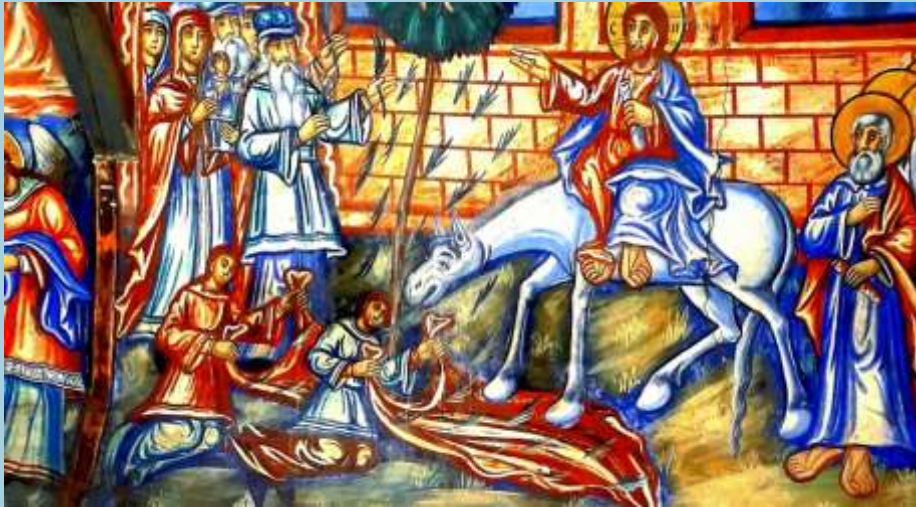
Влизане в Йерусалим