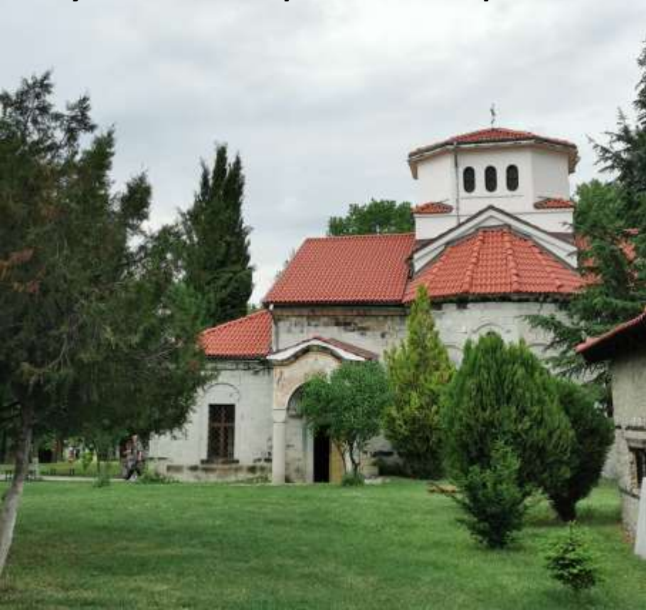
Черквата в двора на манастира

В средата на манастирския двор се издига внушителна трикорабна, триабсидна каменна черква с един купол и преддверие. Тя е построена през 1859 г. и представлява интересен паметник на българската възрожденска архитектура, затова и в архитектурно отношение манастирът се отличава с голямо разнообразие, оригинални хрумвания и смесица от стилове и предпочитания в изграждането на двуетажни и триетажни сгради