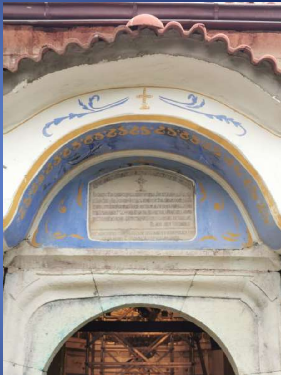
Надписът на входа на църквата в двора.