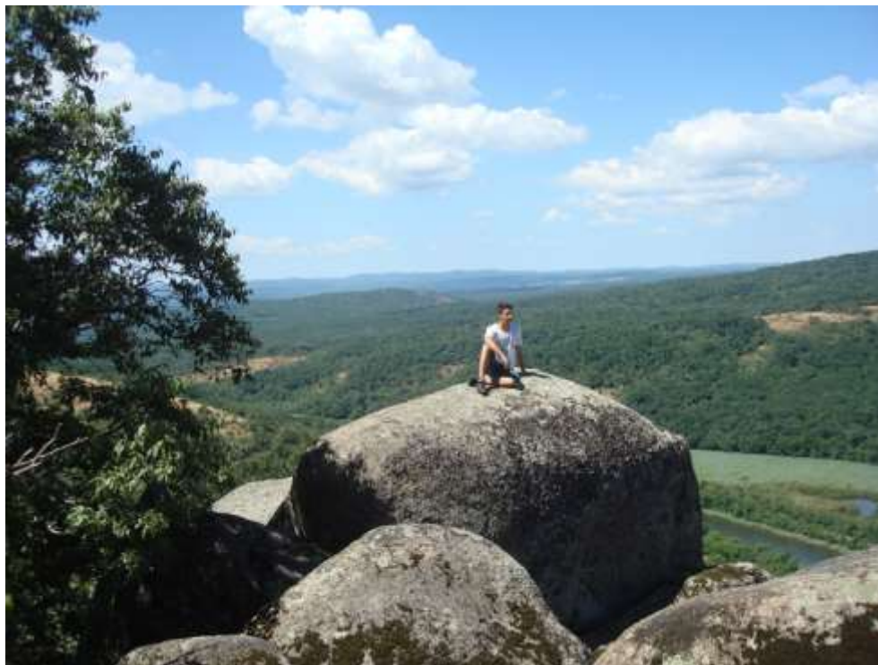
Изглед от Лъвската глава

След досег с красиви, древни, мистични, уединени места като тези човек е различен. Отваря душата си за позитивни мисли, спокойствие и вяра. Там, където времето като че да е спряло, човек може да забави своя ход, да се огледа и да прозре истини. Заобиколен от мегалити, стоящ на брега на морето, вперил поглед в безкрайната шир, разбираш какво е да си жив.