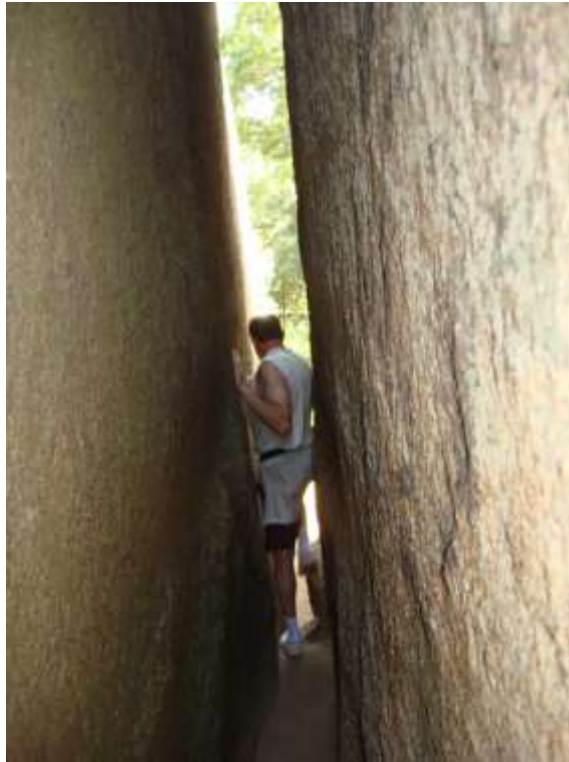
Тате минава през Лабиринта

Лабиринтът, чийто процеп е с широчина по-малка от 50 см, е дълъг 6м. Преминаването през него е било част от предизвикателствата, които трябвало да се преодолеят преди посвещаване. Днес се вярва, че само хора с чиста душа и помисли могат да достигнат до другата страна. Когато за първи път преминах през него, бях малка и дори не трябваше да се обръщам настрани. Според предание човек, пеминал през цепнатина, се пречиства и се освобождава от негативизма и лошите помисли.