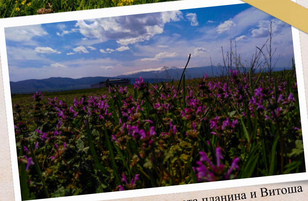
Лозенската планина и Витоша