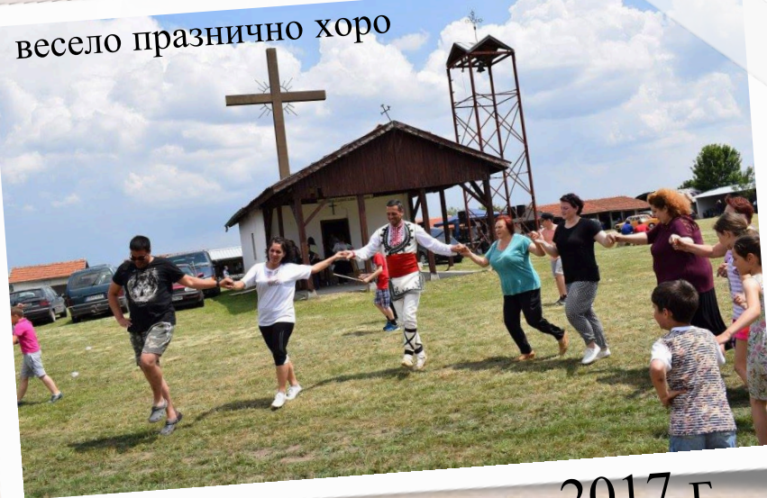
весело празнично хоро