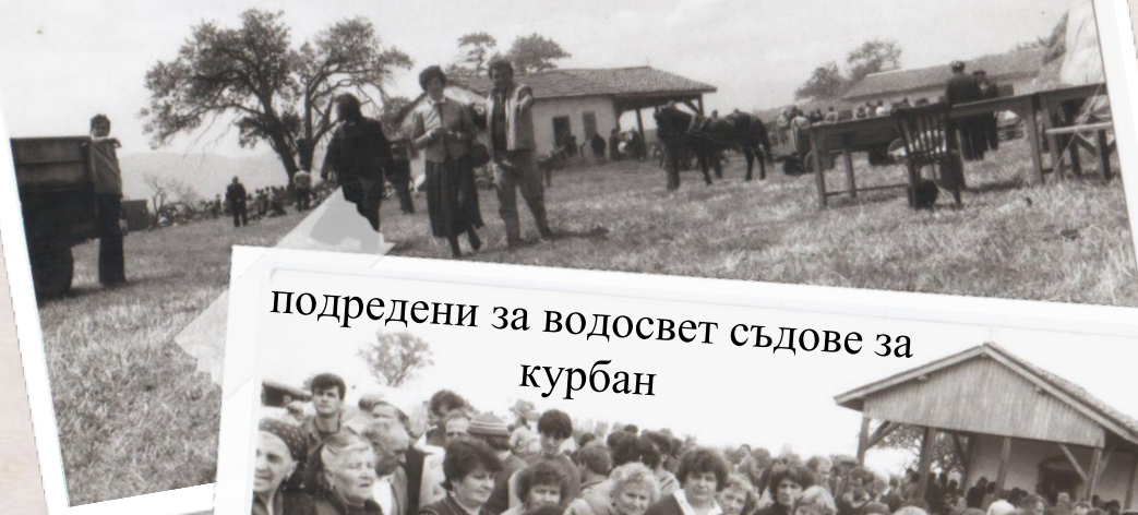
семејства в очакване на почетокот на празникот