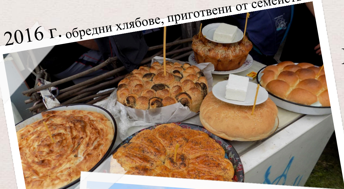
2016 Г. обредни хлябове, приготвени от семействата