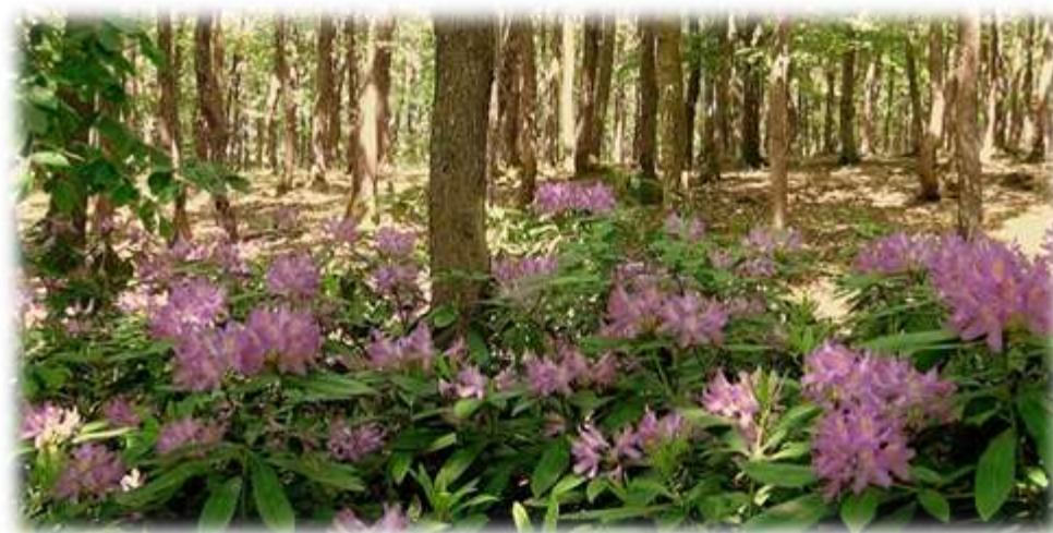
Странжанска зеленика.

Всички тези обекти са една малка част от тайните, които се крият в „малката” планина, както я наричат местните хора. А знаехте ли, че зелениката е цвете, което е защитен вид и се среща само в Странджа? Дори има и фестивал на зелениката, който продължава три дни, организират се походи по екопътеките,където тя вирее.